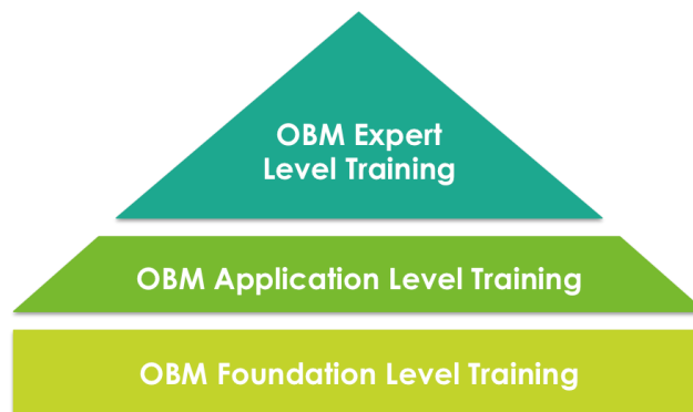
Abbildung 1: Entwicklungspfad OBM Dynamics. Die Ebenen Application & Expert werden gerade im Detail entwickelt.

OBM-Trainings und -Zertifizierungen sind für jeden geeignet, der für die Verbesserung der individuellen und der Teamleistung verantwortlich ist. Das umfasst Führungskräfte, Manager, Berater, Coaches und Personalverantwortliche ebenso wie die ausführenden Individuen.